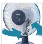
Oscilación horizontal Horizontale Oszillationsfunktion Oscillation horizontale Oscilação horizontal Horizontal tilting feature