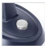
3 posiciones de velocidad (2 en el VT8805) 3 Geschwindigkeitsstufen (2 bei VT8805) Vitesse: 3 positions (2 sur le VT8805) 3 posições de velocidade (2 no VT8805) 3 speed settings (2 in model VT8805)