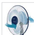
Oscilación horizontal Horizontale Oszillationsfunktion Oscillation horizontale Oscilação horizontal Horizontal tilting feature