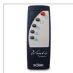
Mando a distancia Fernbedienung Télécommande Comando à distância Remote control