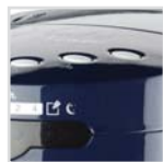
3 modos de funcionamiento: normal-ahorro-noche. 3 Betriebsarten: Normal-Energiesparmodus-Nacht. 3 modes de fonctionnement: Normal - économie - nuit 3 modos de funcionamento: normal-economia-noite. 3 Operating modes: normal-saving-night.