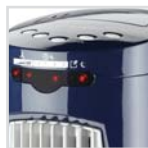
Led's luminosos LED-Betriebsanzeigen LED lumineuses Leds luminosos Light leds