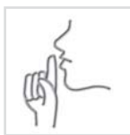
Silencioso Leise Silencieux Silencioso Quiet