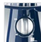
Temporizador de apagado Timer mit Abschaltautomatik Timer arrêt Temporizador de desligamento Power-off timer