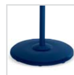
Base de máxima estabilidad Sehr stabiler Sockel Base avec stabilité maximale Base de máxima Maximum stability base